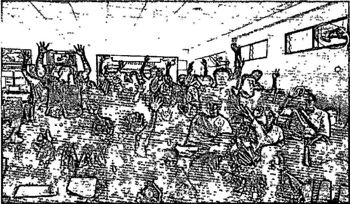
EB1(1) ภาพถ่ายกิจกรรมที่แสดงชื่อผู้ให้บริการ ผู้มีส่วนได้ส่วนเสียร่วมแสดงความคิดเห็น