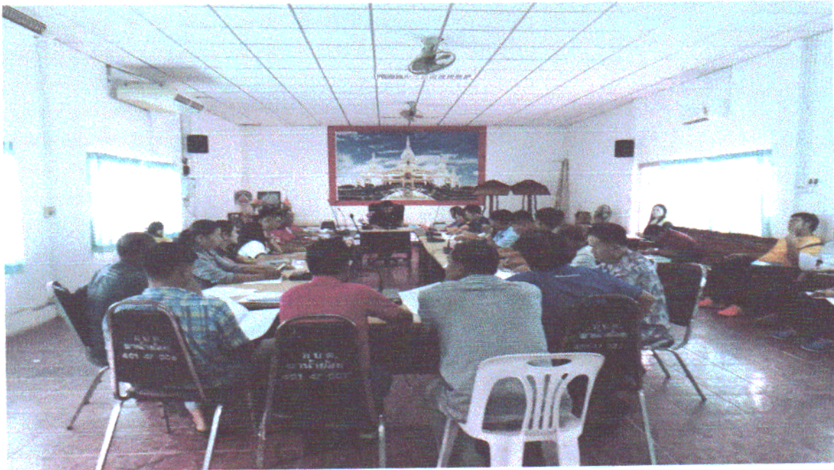
EB1(2) ภาพถ่ายกิจกรรมที่แสดงชื่อผู้ใช้บริการผู้ ผู้มีส่วนได้ส่วนเสียร่วมแสดงความคิดเห็น